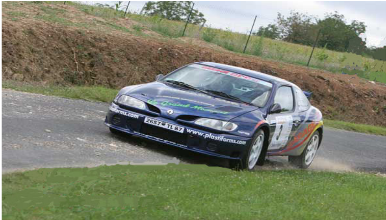
Coupe de France des Rallyes 2008